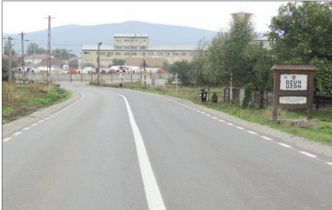
UZON MODERN BEJÁRATA

Valójában a fent említett településeinken nincs sok választópolgár, de vannak