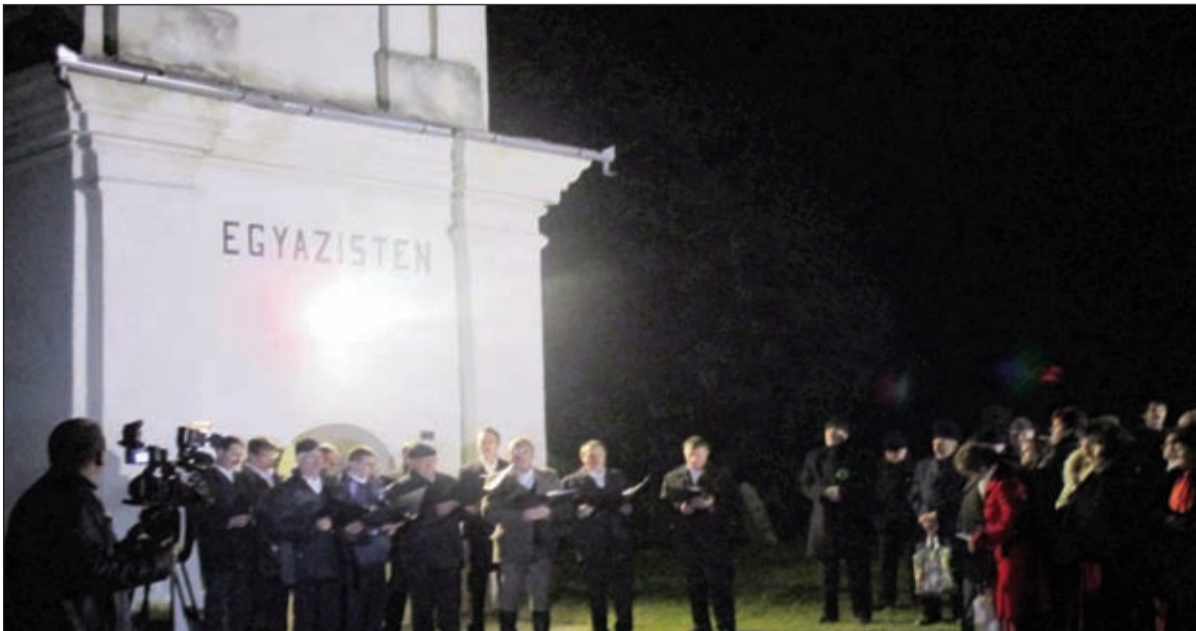
ESTBE HAJLÓ EMLÉKEZÉS - A SZERZŐ FELVÉTELE