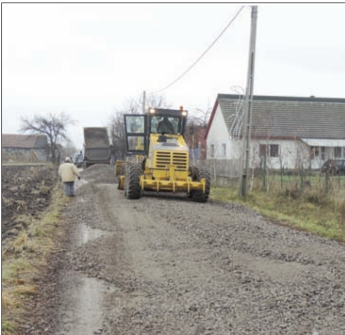
MUNKÁBAN AZ ÚJ FÖLDGYALÚ

Kedves Polgárok, ahogy látják, akad bőven probléma, meg akadály is. De én úgy tartom, hogy csak akkor ütközünk nehézségekbe és néha embelekbe is, ha dolgozunk, ha alkotunk. Ha nem tennénk semmit, akkor probléma sem lenne, de haladás, fejlődés sem. Ezért nehéz becsületes közszereplést vállalni, mert az egyenlő a problémák halmazával. A befektetett energiát és a kitaró munkát semmi sem tudja jobban értékelni és megköszönni, mint azok a hálás tekintetek és szépszavak, amelyből egyre többet kapunk az elmúlt években. Nem tudom felejteni a sepsimagyarósiak tekintetét a falujukba vezető út leaszfaltozásakor, a liznyópataki meg az uzonfüzesi lakosok elismerő szavait az elmúlt napokban történő masszív ütkövecsezésekkor, az iskolások és óvodások boldog arckifejezésüket a karácsonyi csomag átvételekor és még nagyon sok hasonló felemelő pillanatot. Ezért kell és érdemes becsületesen dolgozni, hisz az igazságos és kitaró munka mindig meghozza a siker gyümölcsét.