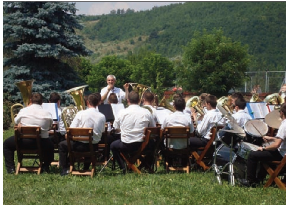
“MUNKÁBAN A ATLANTISZ FÚVÓSZENEKAR”

- Minden helyi rendezvényen fellépünk. Községünkön kívül felléptünk Zágomban, Komandón, Rétyen, Barátoson, Bodolán, Szentivánlaborfalván, Feketehal-