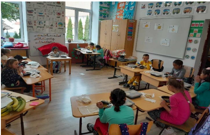
Copii din satul Lisnău la prânz