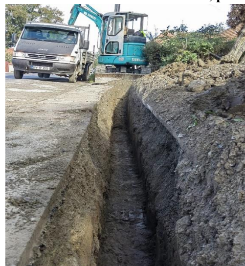
Bordás Enikő, primar