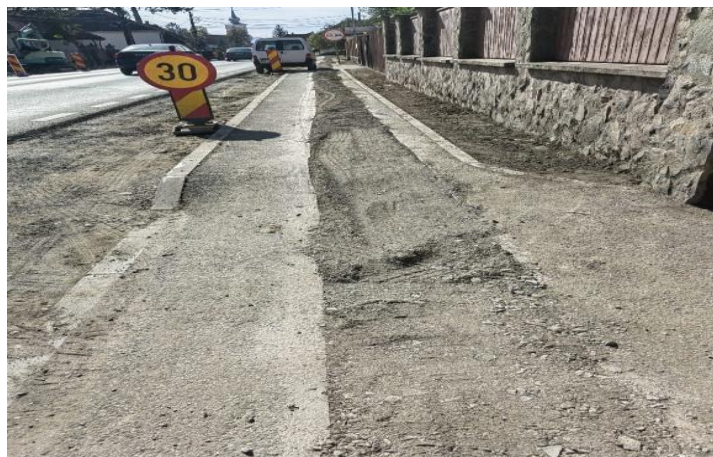
Instalarea conductei de gaz în Ozun

Sperăm că vom reuși să finalizăm cu succes, cât mai curând posibil, această lucrare de amploare, după care străzile din comuna noastră vor fi din nou curate și ordonate, iar comunitatea noastră va beneficia de o rețea de gaze naturale și avantajele acesteia, toate acestea servind bunăstarea și confortul localnicilor.