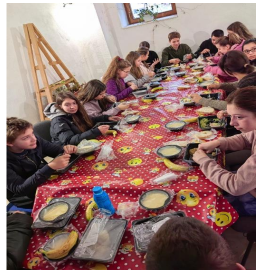
Clasa a VII-a în pauza de prânz