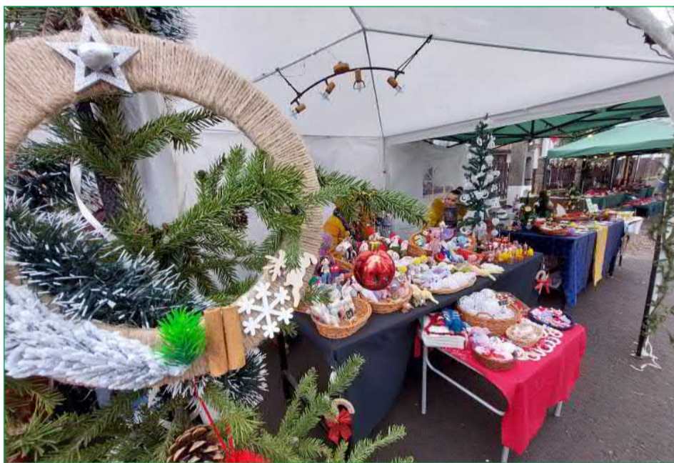
A 2023-as karácsonyi vásár

Az idén is kerültek olyan jószívű adakozók, akik a felkérésünknek eleget téve, biztosították az anyagiakat a karácsonyi ajándékoknak a beszerzésére, így újra több mint 500 élelmiszercsomagot állítottunk össze és eljuttattuk azokat még karácsony előtt az arra jogosult személyekhez. A gyerekeknek szánt ajándékok kiosztását Karácsony apó gondjaira bíztuk, aki majd gondoskodik arról, hogy minden, a község óvodáiban és iskoláiban tanuló gyerek megkapja a saját ajándékát.