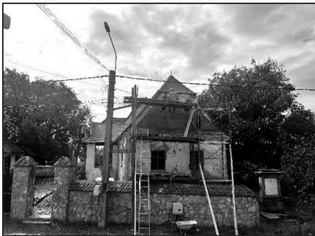
Homlokzat restaurálás az Erdélyi kúriánál

Az identitásunk és kultúránk megőrzése szempontjából, fontos számunkra, hogy megőrizzük hagyományainkat és továbbadjuk azokat az elkövetkező nemzedékek számára, gyerekeink és unokáink tovább vigyék azokat a szokásokat és népi elemeket, amelyek meghatároznak minket. A nyolc házból, amelyek a fent említett projekt tárgyát képezik, két épület az önkormányzat tulajdonában levő ingatlan,