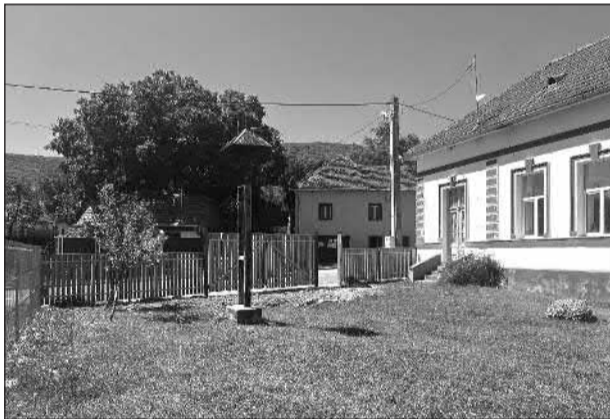
Csendes harang a sepsimagyarósi iskolaudvaron

Az egyre fogyó népesség, amely egy általános jelenség kisebb és nagyobb régiókban egyaránt, az ilyen kis településeken még jobban érezteti hatását, ugyanis azokban a kis lélekszámú falvakban, mint amilyen Sepsimagyarós is, ahol nincs helybéli munkalehetőség vagy megélhetési forrás, a fiatal generáció kénytelen elmenni más nagyobb településekre, városokba munkát találni és ott családot alapítani. Így elkerülhetetlen, hogy egy napon már nincs annyi gyerek, hogy elég legyen bár egy összevont 1-4 osztály létrehozására, egy óvodai csoport fenntartására.