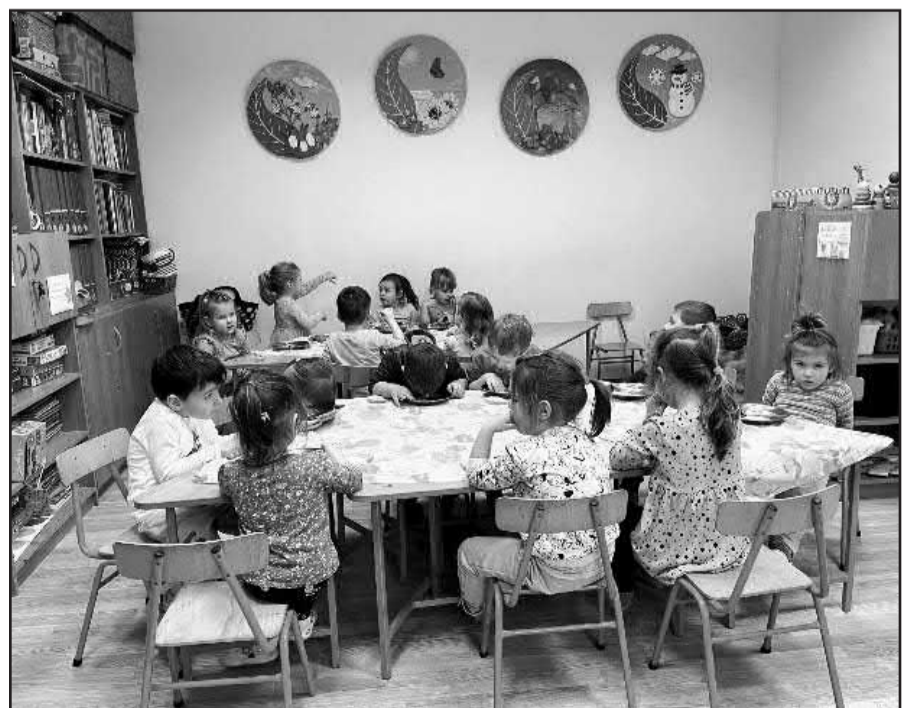
Napközi otthon gyerekek tevékenység közben