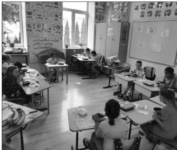
Lisznyói gyerekek ebéd közben

A napi három fogásból álló ebédet (leves, főétel és gyümölcs) egy szépszentgyörgyi cég szállította a gyerekek számára. A menü összeállítását dietetikus szakember végezte, aki figyelembe véve a megfelelő kalória mennyiségeket és ételféleléseket, szakszerűen előre megtervezte a gyerekek számára előállítandó ételek listáját. Az ebéd fogásai külön hermetikusan zárt csomagolásban érkeztek